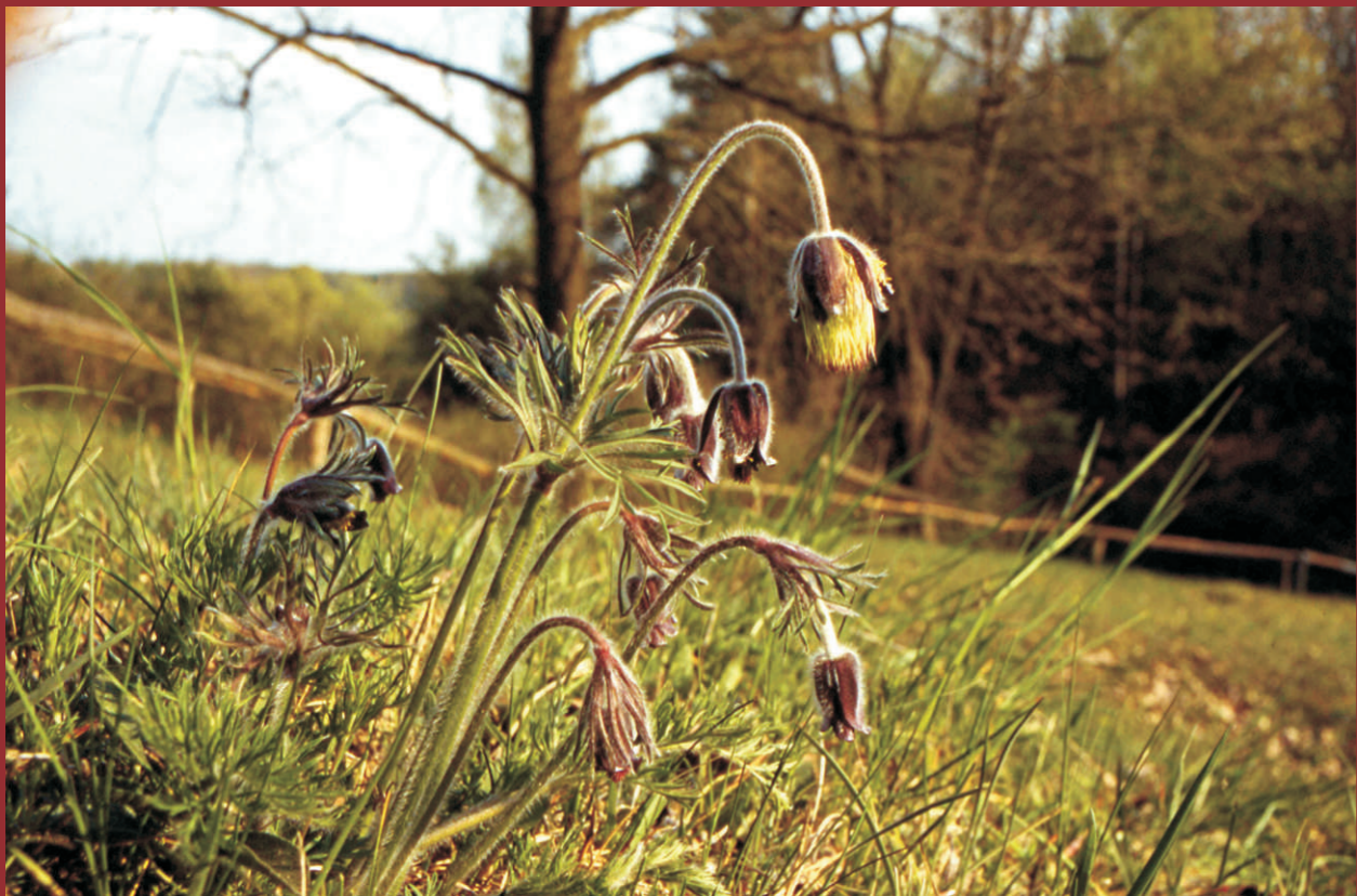
Die nickenden Blüten der Wiesen-Kuhuschelle ( Pulsatilla pratensis ssp. nigricans ) findet man im April und Mai recht selten auf den Trockenrasen der Oderhänge bei Mallnow, Wuhden und Lebus. Natura 2000: Subpannonische Steppen-Trockenrasen