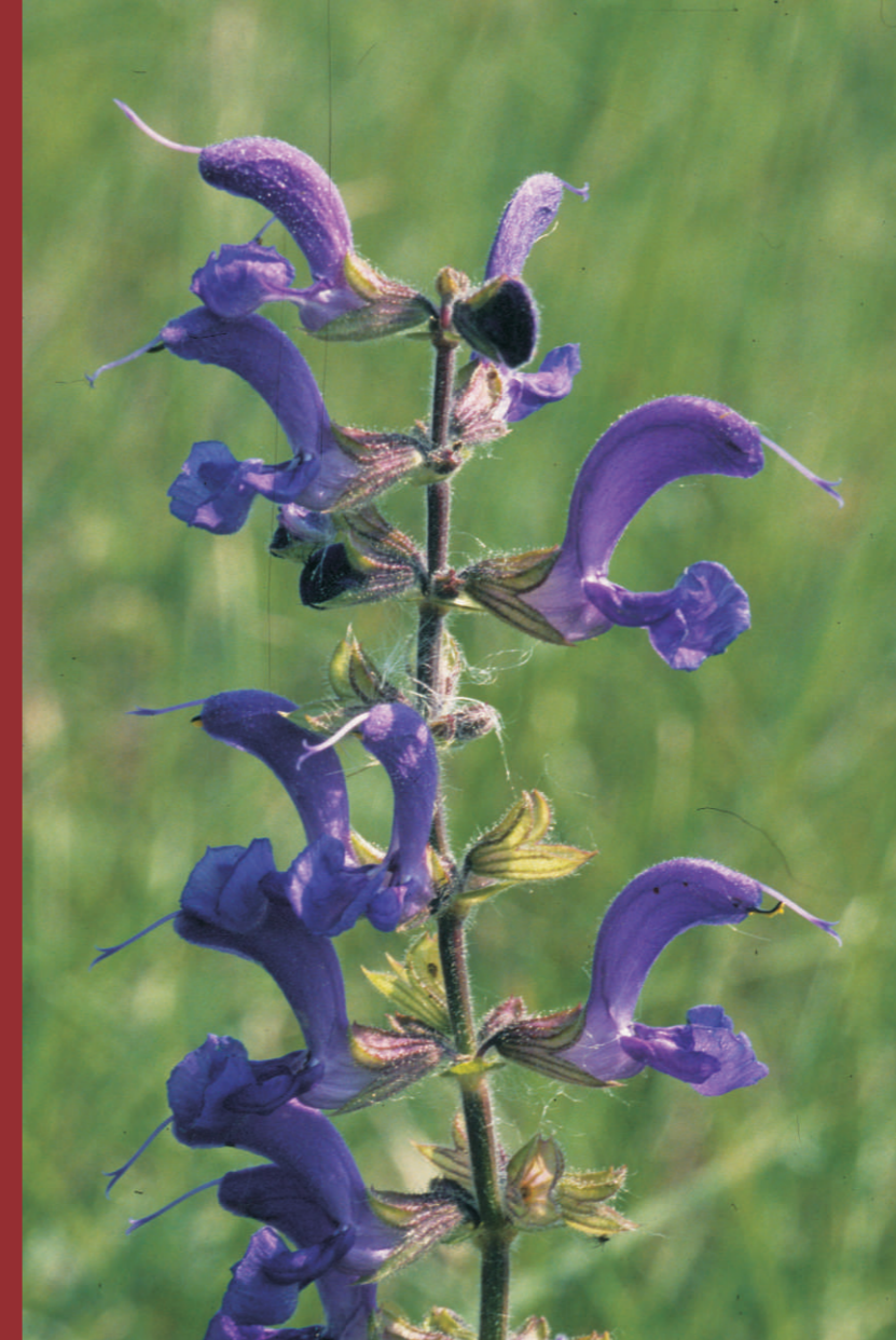
Der Wiesen-Salbei ( Salvia pratensis ) gehört zu den für Trockenrasen typischen Pflanzenarten. Er blüht an den Oderhängen von Seelow bis Lebus recht häufig, gilt jedoch brandenburgweit als gefährdet. Natura 2000: Naturnahe Kalk-Trockenrasen