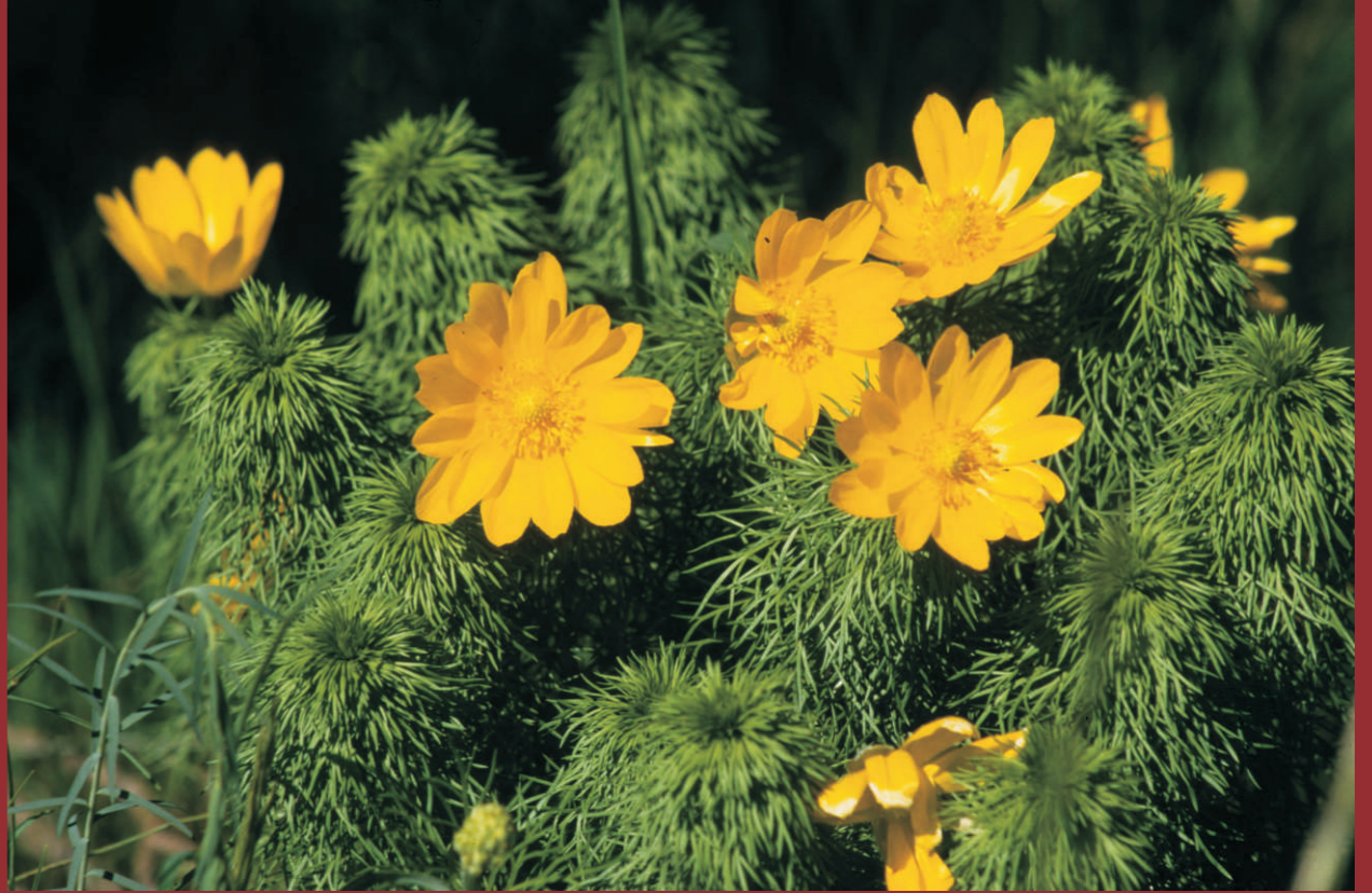
Die Blüte des Frühlings-Adonisröschens ( Adonis vernalis ) bezaubert alljährlich im März und April zahllose Besucher an den Oderhängen Mallnow und den Oderbergen Lebus. NATURA 2000: Subpannonische Steppen-Trockenrasen