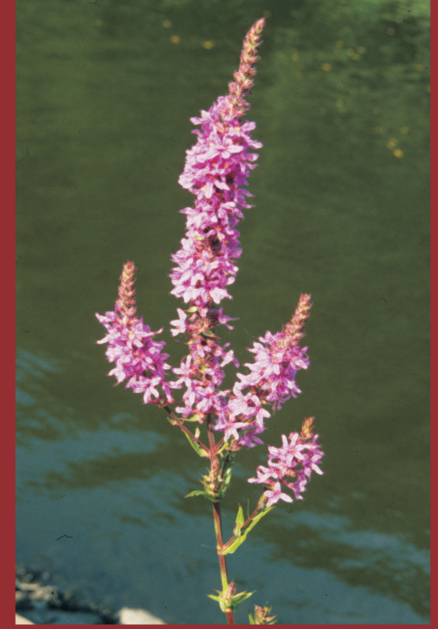
Der Gemeine Blutweiderich ( Lythrum salicaria ) besticht durch leuchtend purpurrote Blütenähren. Zu bewundern sind sie von Juli bis September in den Hochstaudenfluren der Flussauen, z. B. an der Oder und dem Klingeließ. Natura 2000: Feuchte Hochstaudenfluren