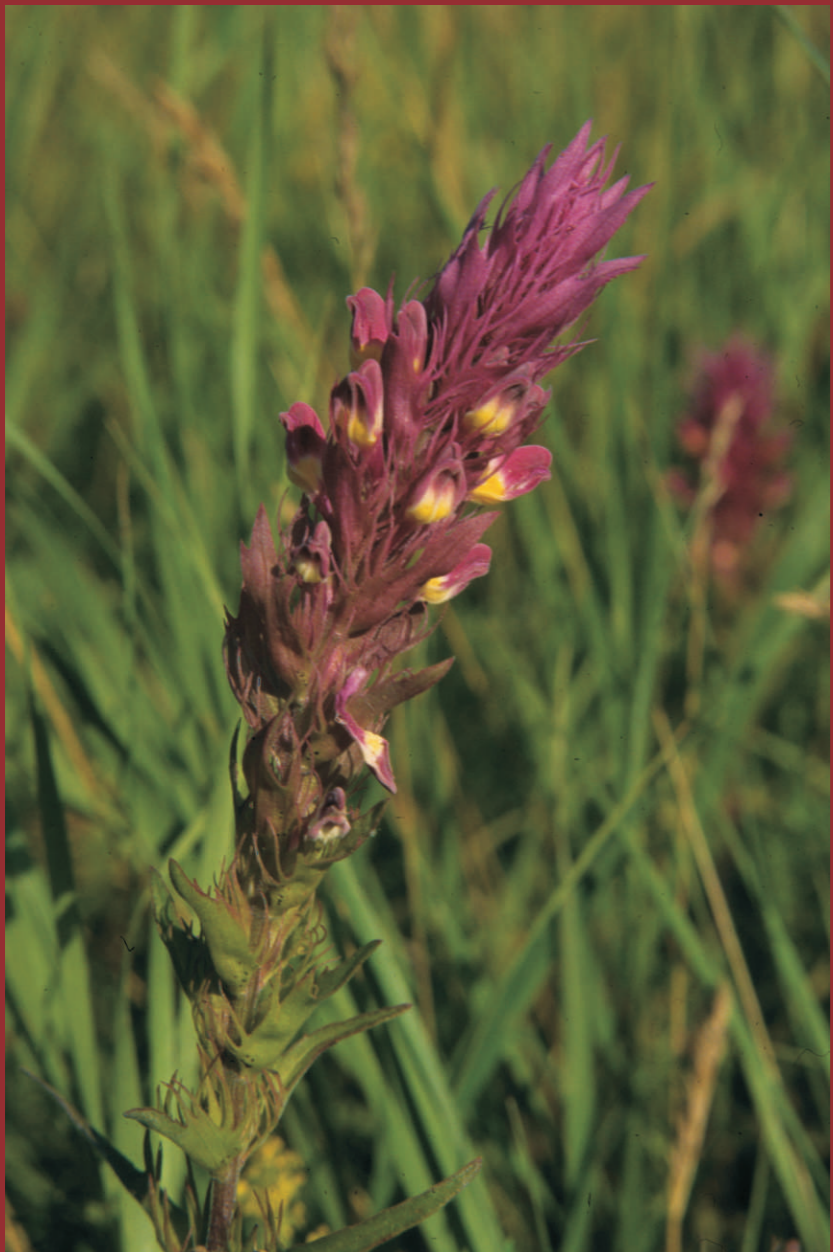
Der Acker-Wachtelweizen ( Melampyrum arvense ) zeigt seine purpurnen Blütenähren von Mai bis September. Er wächst an den Oderhängen zwischen Seelow und Lebus. Natura 2000: Subpannonische Steppen-Trockenrasen

Der Landschaftspflegeverband Mittlere Oder e. V. und seine Kooperationspartner stellen hier einzelne Pflanzenarten vor, die als charakteristische "Edelsteine" der jeweiligen Lebensräume dieses Europäische Naturerbe in unserer Region repräsentieren.