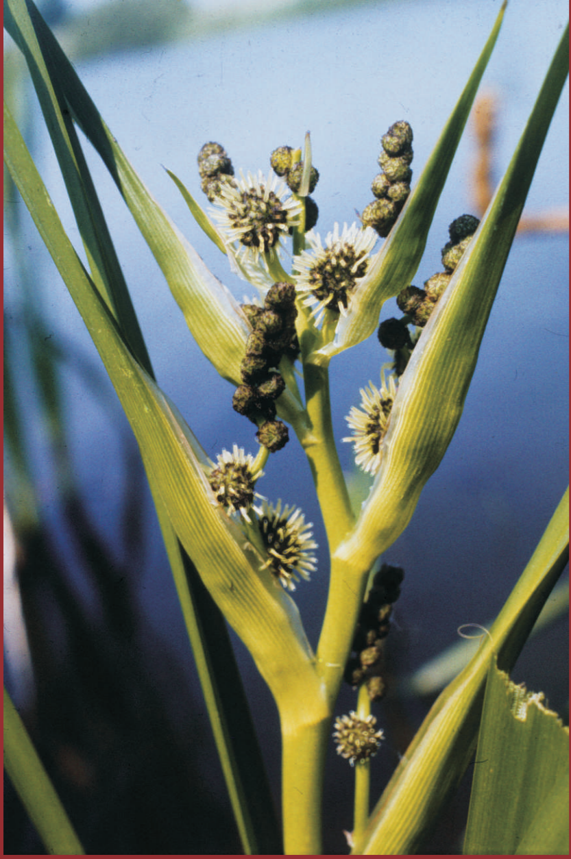
Der Ästige Igelkolben ( Sparganium erectum ) bekam seinen Namen durch die Form der Fruchtstände. Diese "Igel" können ab Juli in den Röhrichten der Oderaue und im Booßener Teichgebiet entdeckt werden. NATURA 2000: Flüsse der planaren bis montanen Stufe