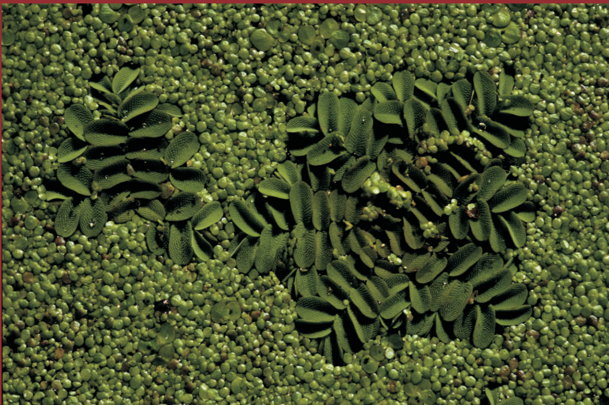
Der Gemeine Schwimmfarn ( Salvinia natans ) in seiner geometrischen Form ist in Brandenburg vom Aussterben bedroht. Er schwimmt von August bis Oktober auf warmen, nichtdurchströmten Altarmen der Oder von Aurith und Frankfurt (Oder) bis Kienitz. Natura 2000: Natürliche eutrophe Seen