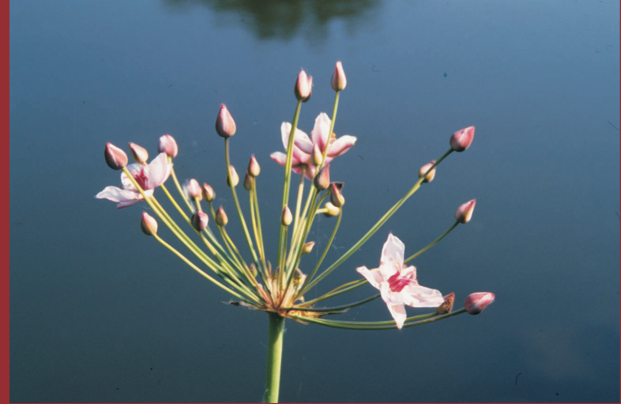
Die im Hochsommer blühende Schwanenblume ( Butomus umbellatus ) bereichert als Stromtalpflanze die Uferzonen und Auenbereiche von Oder und Neiße, wächst aber auch am Booßener Mühlenfließ. NATURA 2000: Flüsse der planaren bis montanen Stufe