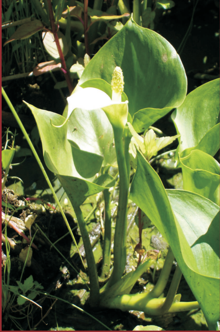
Die mit einem Blütenkolben geschmückte Schlangenzunge ( Calla palustris ) ist deutschlandweit gefährdet. In der Oderaue kommt sie noch im Faulen See bei Frankfurt (Oder) vor.