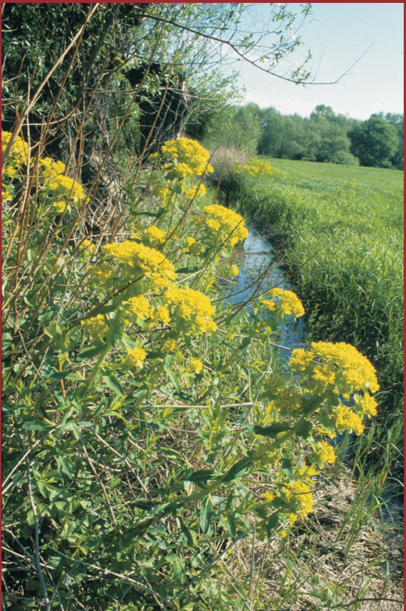
Die Sumpf-Wolfsmilch ( Euphorbia palustris ) wird bis zu 1,50 m hoch. Ihre großen, gelb-grünen Scheindolden heben sich im Mai und Juni vom dunklen Grün der Auenwiesen an der Oder von Aurith, Frankfurt (Oder), Lebus bis Hohenwutzen ab. Natura 2000: Feuchte Hochstaudenfluren