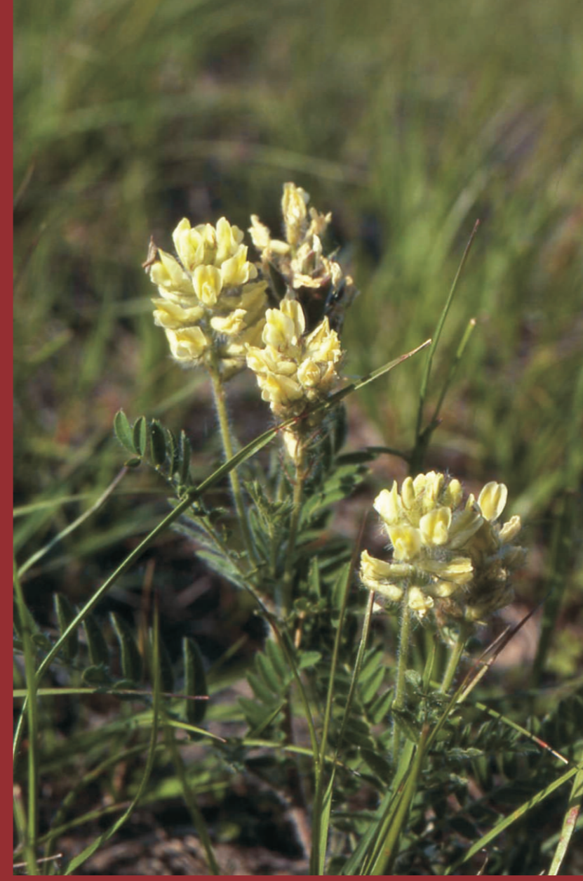
Die im Juni und Juli blühende Steppen-Fahnenwicke ( Oxytropis pilosa ) kommt in Brandenburg nur an den Oderhängen z. B. bei Mallnow vor. Natura 2000: Subpannonische Steppen-Trockenrasen